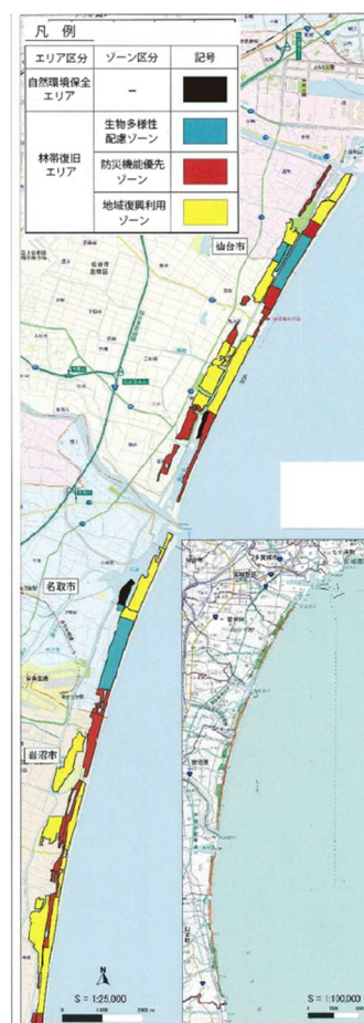
図3 仙台湾における海岸防災林の整備範囲. 林野庁資料(仙台湾沿岸海岸防災林の復旧における生物多様性保全対策について http://www.rinya.maff.go.jp/tohoku/koho/saigaijoho/h25_sendaiwankankyuu.html , 2016年11月2日確認)を一部改変.

本研究の研究成果は、 33件 (うち査読付論文 13件 )の雑誌論文、 7件 の図書にまとめられた。主な研究成果としては、以下の 4点 が挙げられる： (1) 復旧事業地における生態系全般にかかわる資料およびデータを収集し、記録として残した、 (2) 再生した海岸防災林の植物多様性が低いことを明らかにした、 (3) 海岸防災施設