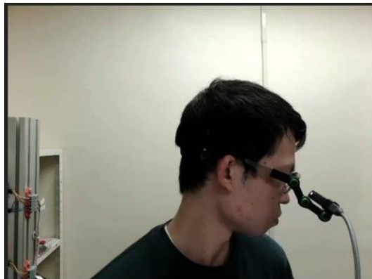
図 5 視線計測による注視時間計測実験の様子

作業中にシステムから作業者へ与える音リズム等の作業効率への影響について実験により調査した。作業指示を与えるディスプレイの注視時間に着目し、作業評価を行った。(図5)