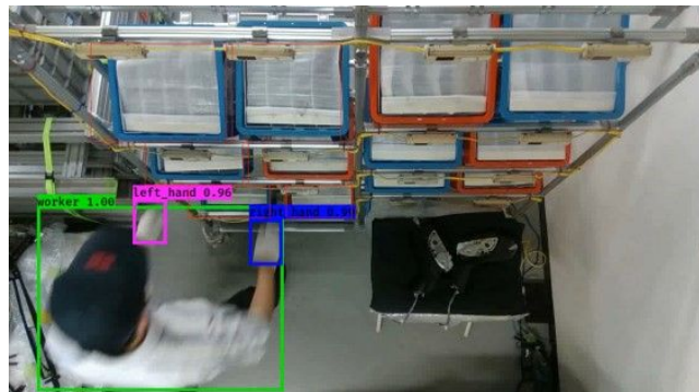
図 3 動作認識実験の様子

カメラにより計測された作業者の動作を機械学習アルゴリズムにより認識し、認識対象がカメラに写っていない時にも動作予測が行えるアルゴリズムを研究開発した。( 図 3 )