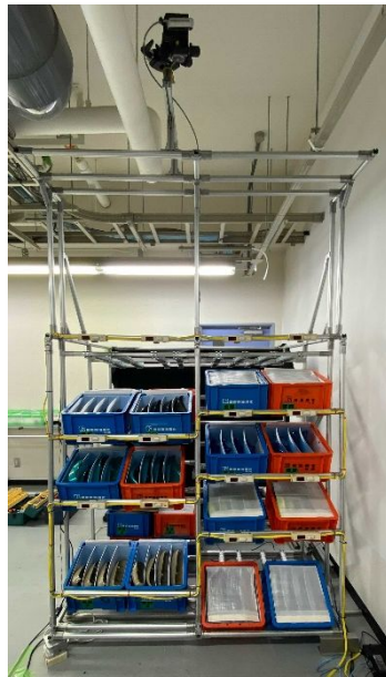
図 2 製作した動作計測システム

作業者の動作を計測する距離計と測域センサおよびビジョンシステムをベースとしたシステムを構築した。( 図 2 )