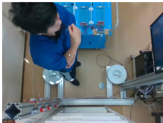
図 4 製作したピッキング・キッティング実験環境

ピッキング・キッティングタスク中の作業者に対して、計算課題などの負荷を与え、ヒューマンエラー発生率などの作業への影響を調査した。( 図 4 )